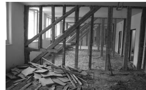
Freie Sicht durch die Tragstruktur