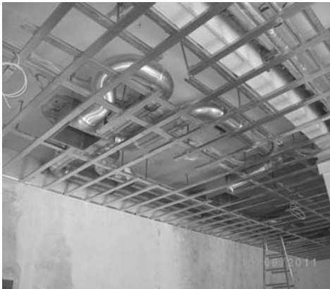
Unterkonstruktion Abhangdecke mit Lüftung