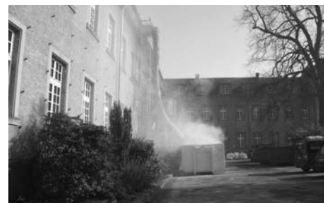
Staubentwicklung während des Abbruchs