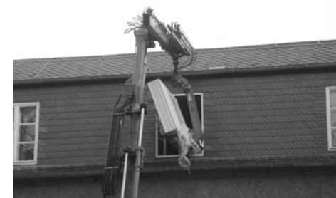
Anlieferung der Trockenbauplatten