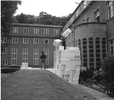
Anlieferung Styropor für den Estrich