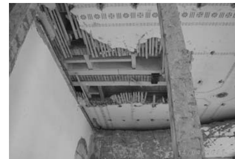
Untersicht der Bestandsdecken