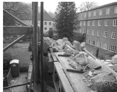
Abtransport des Abbruchmaterials